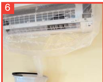
6 ...asegurándose de que el tubo de drenaje descarga en un contenedor apropiado.