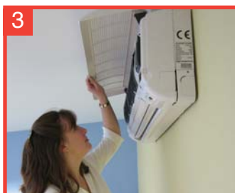
3 Abra la persianilla de toma de aire.