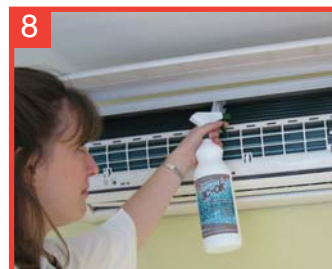
8 Siga aplicándolo horizontalmente y hacia abajo, de forma metódica. Mantenga la boquilla del spray a una distancia no superior a 5cm del intercambiador.