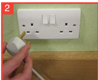
2 ...desconéctela de la toma de corriente