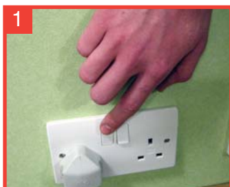
1 Apague la unidad...

de interior le garantiza que la parte de su sistema de aire acondicionado que está en el interior se mantiene limpia. Lea detenidamente esta hoja de instrucciones y todas las etiquetas antes de utilizar el producto. Le recomendamos que limpie la unidad de aire acondicionado al menos dos veces al año, a intervalos de seis meses.