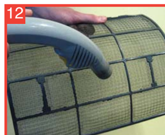
12 Limpie el filtro con una aspiradora, vuelva a montar la unidad, enchúfela a la toma de corriente y enciéndala.

No es necesario aclarar. El producto usado y la suciedad se drenarán de la forma habitual. Siga limpiando hasta que el líquido salga limpio del intercambiador.