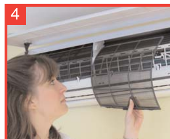
4 Retire todos los filtros (primarios y secundarios, en su caso).