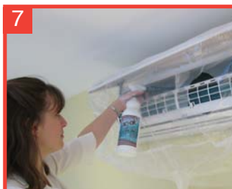
7 Pulverice el spray AC-OK en el intercambiador, empezando desde uno de los extremos de la parte superior.