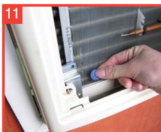
11 Coloque una pastilla de tratamiento AC-OK en la bandeja de condensado, si fuese accesible.