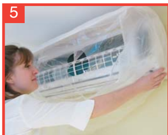
5 Coloque y ajuste una funda de limpieza AC-OK alrededor de la unidad...